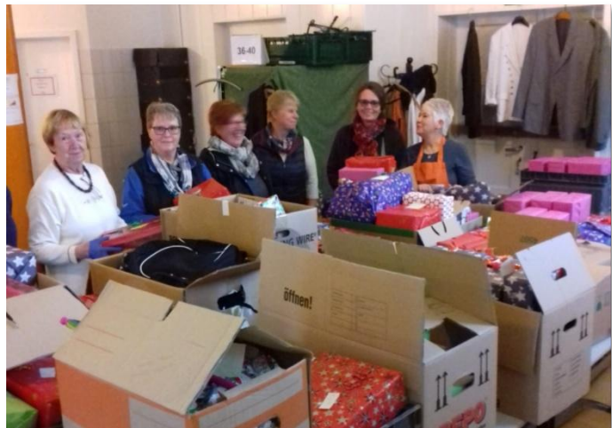
Übergabe der restlichen 210 Päckchen an die Peiner Tafel

Kinder freuen sich, wenn das Weihnachtspäckchen genau ihren Geschmack trifft. Darum haben wir liebevoll und zielgerichtet die Geschenke nach Alter und Junge/Mädchen sortiert.